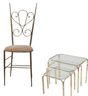
(上) 華奢でエレガントなデザインが魅力。1960年代(推定)イタリアンプラスチックア137,500円 (下) グラストップネストテーブル132,000円