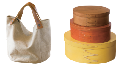
(右) シェーカー教徒の哲学を感じるオーバルBOX。下から28,600円、20,900円、18,700円 (左) オリジナル帆布生地を使ったフレスコパケツバックS15,400円