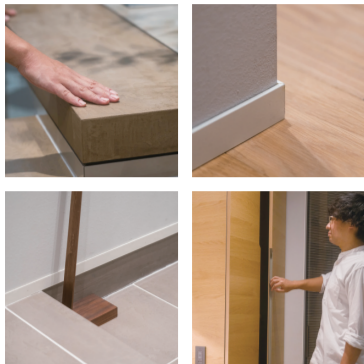
窓枠やドアの枠の太さは全体の調和を考えて計算。床と壁の間の巾木は存在感を消すようにできるだけ細く。「気にしない人も多い箇所をいかに気にするか。お客様がご希望の素材もいかに組み合わせるか。コーディネート力が大事です。」

住宅先進国のドイツやアメリカでは、自分の家に愛着を持ちメンテナンスを繰り返しながら長く住む人がほとんどなのだそう。同じように、日本の「家が家」もお互い入りのデザインであれば、「磨いて大事にしたい」壊れても直して住み続けたい」と思えるようになり、日本人の家への意識も変わっていくのかも。愛着を感じるデザインにはそのチカラがあるのです。