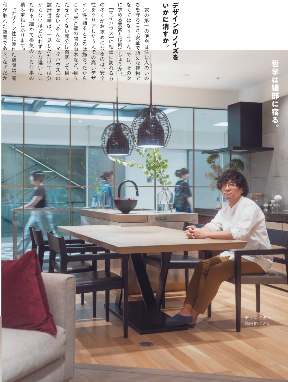
哲学は細部に宿る。