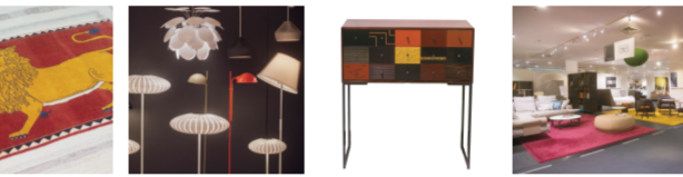
A. お客様と関わる仕事に魅力を感じて入社。わかりやすい商品説明も好評な渡辺翔太さん / B.各機様に意味があるオールドギャベライオン255,000円 / C.照明コーナーには照明コンサルタントの資格を持ったスタッフも / D.国の伝統工芸の指定を受ける香川漆芸の技法を含め、異なる技法を前板に施したチェスト あざみ三 色漆1,168,200円

知識がご判断材料のひとつになれば何よりです。営業歴11年の渡辺翔太さん。時には、家具選びの第一環としてお客様の自宅にうかがい、現場を見ながら商品をご提案することもあるそうです。お客様との間に確かな信頼関係が育まれていてこそ、そのエピソードです。